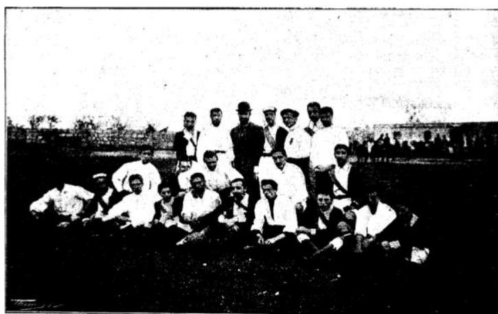
Figura 3. Los equipos “España” y “Barcelona”, después de jugar un partido en Palma de Mallorca.

Revisión. Revisión documental. Los inicios del fútbol en Palma de Mallorca, en torno a los orígenes del deporte escolar. Vol. V, nº. 1; p. 3-29, enero 2019. A Coruña. España ISSN 2386-8333 como una expresión de participación libre y democrática, como un proyecto de vida, que superaba, incluso, a la autoridad científica y la disciplina moralizante con la que se quería imponer la gimnástica escolar. El deporte (el fútbol) estaba empezando a ganar los primeros pulsos a la Educación Física (Torrebadella, 2012c). No obstante, como tratan Torrebadella y Vicente (2017, p. 14), el fútbol también representaba “un dispositivo disciplinario y de dominación” en el seno de las instituciones escolares.