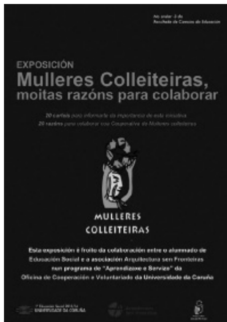
Fotografía 4: Panel de inicio da exposición.

5. A avaliación do proceso e dos resultados concreouse na avaliación do deseño da campaña de sensibilización e das accións contempladas, por parte do profesorado implicado e das Mulleres colleiteiras; foi un proceso de avaliación continua en sesións de titoría e de avaliación final, no que tamén participaron ASF e as Mulleres colleiteiras , que comprobaron un incremento moi importante de aceite depositado nos contedores no remate da campaña de sensibilización.