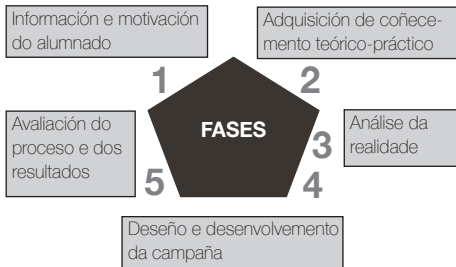
Gráfico 1: Fases do proxecto de Aprendizaxe e servizo

4. Deseño e desenvolvemento da campaña de sensibilización que tivo dúas fases. No primeiro cuatrimestre, o alumnado de terceiro curso deseñou “accións de impacto” para chamar a atención sen achegar información sobre o proxecto (Fotografías 2 a 3). Deseñouse un power-point e un vídeo para informar nas aulas ao resto de cursos e titulacións da Facultade.