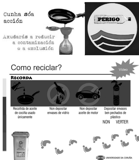
Fotografías 2 a 3: Exemplos da campaña de motivación e divulgación