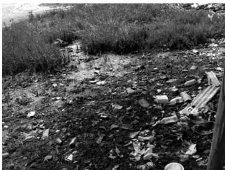
Figura 11: Esgoto lançado diretamente no manguezal.

A despeito da atitude da comunidade em lançar esgotos e resíduo no ambiente, verificou também que a área urbana da ilha dispões de regular e eficiente limpeza pública e coleta dos resíduos, pavimentação em todas as ruas, abastecimento de água tratada ofertada pela concessionária credenciada pela Prefeitura Municipal, fornecimento de energia elétrica adequada. Porém toda a rede de drenagem pluvial escorre diretamente para o manguezal o que se constituem em mais um problema para o ambiente do entorno. No entanto, nos chamou atenção para o fato de existir nenhuma destinação adequada do esgoto por parte do poder público e muito menos pela comunidade, exceto algumas fossas sépticas rudimentares e construídas no manguezal que lamentavelmente estes equipamentos eram instalados sem os devidos cuidados para evitar a contami-