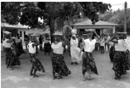
Figura 6: As Paparutas em ação.

O grupo As Paparutas Boas é formado por cerca de dezenove mulheres de distintas idades, que se caracterizam com roupas longas e muito coloridas. (Figura 6) Em geral são saias estampadas e blusas lisas de cores vivas. Utilizam utensílios de cozinha na cabeça, quase sempre um tacho de madeira ou barro, onde são acomodados os alimentos por elas preparados. As comidas típicas de forte influencias africana, após o ritual de danças e cantorias são oferecidas ao final da apresentação aos presentes. (Figura 7) As músicas utilizadas nos folguedos são compostas quase sempre pelos músicos integrantes do referido grupo cultural, na sua maioria homens, mas também há mulheres e formado por onze pessoas de idades variadas que tocam instrumen-