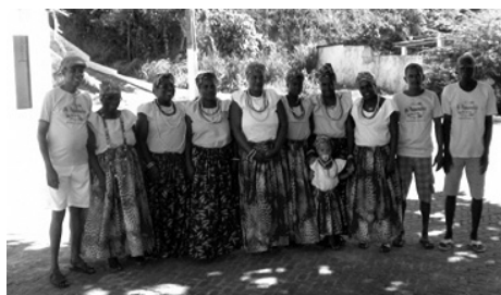
Figura 5: Parte dos integrantes do Grupo Cultural As Paparutas Boas do Paty.

É nesse contexto que se insere a comunidade da Ilha do Paty localizada no município de São Francisco do Conde-BA e donde se destacam a secular festa de São Roque (Figura 4) e, em especial, o grupo cultural denominado de As Paparutas da Ilha do Paty, ou simplesmente As Paparutas (Figura 5). O termo vem do nome paparota que significa de papar, comida, refeição. De acordo com líder comunitário Altamirando de Amorim, como as pessoas da comunidade chamavam As Paparutas, manteve-se o nome As Paparutas Boas que, no entendimento local dizem ser Comidas Boas. Verifica-se neste contexto para a compreensão da etimologia da palavra encontra-se dificuldades para defini-