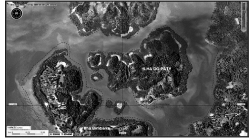
Figura 3: Ao centro a Ilha do Paty. Fonte: SEFAZ/SEPLAN/SEHARF/SEDES, 2013. Adaptação: Edvaldo Santos, dez. 2016

A matriz da educação ambiental não-formal fomentada no território brasileiro, prevista pela Política Nacional de Desenvolvimento Sustentável dos Povos e Comunidades Tradicionais e afirma a importância de incentivar a sensibilização ambiental das populações tradicionais ligadas às Unidades de Conservação.