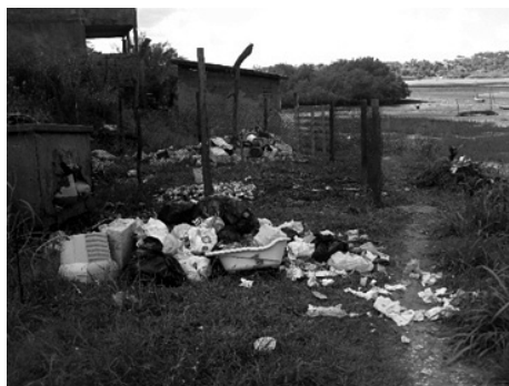
Figura 12: Resíduos sólidos lançados indiscriminadamente no manguezal. Fonte: SEMAAP, 2012. Foto: Morador do local, 2012.

A partir de relatos provocados nos encontros de sensibilização, foi possível perceber a compreensão por parte dos moradores da dimensão dos impactos ambientais negativos decorrentes do descarte inadequado de seus resíduos urbanos no ambiente local, mediante seus depoimentos e registros fotográficos dos problemas realizados pelos mesmos.