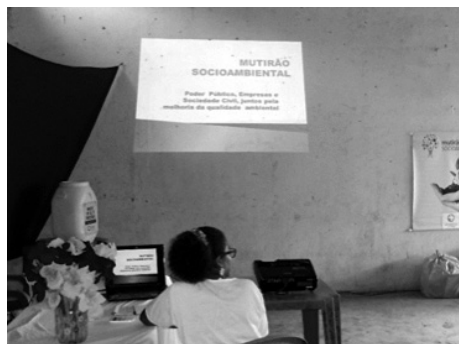
Figura 9: Reuniões diagnósticas, de sensibilização e dos resultados dos mutirões.

moradores da ilha em todos os encontros realizados. A frequência destes momentos leva-se em consideração um cronograma elaborado para atender a todo o território do município, o que resultava em uma frequência aproximada de um por mês ao longo de quatro anos.