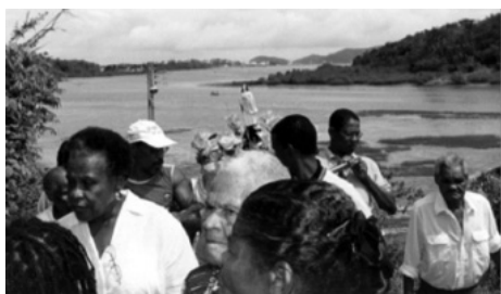
Figura 4: Festa de São Roque na Ilha do Paty, São Francisco do Conde-BA.

“(...) ressalta que a gastronomia se encaixa neste contexto, pois está condicionada pelos valores culturais e códigos sociais em que as pessoas se desenvolvem, ou seja, sua identidade. Além dessa representatividade, a gastronomia sempre será proporcionadora de prazeres não somente palatais, mas também acrescentando ao homem conhecimentos culturais e, conseqüentemente (sic) o status social e a capacidade de convivência e relacionamento com a sociedade.”