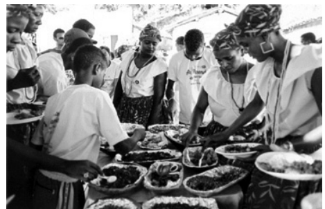
Figura 7: Momento das refeições das Paparutas.