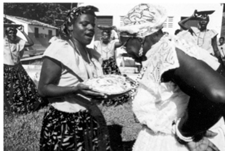
Figura 8: Matriarca conferindo sua bênção ao alimento ofertado.

É esta importante personagem figura como central no folguedo e tem a função, dentre outras atribuições, de aprova ou não os pratos, que lhe são apresentados pelas demais. Importante aqui salientar que, apesar da centralidade de Aiá todas as demais integrantes, também tem importância singular no evento, como forma de enfatizar a irmandade e solidariedade entre os componentes do grupo.