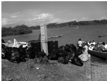
Figura 10: Parte dos resíduos retirados das áreas urbanas da ilha.

Durante a realização das tarefas junto à comunidade o contato sempre se iniciava com uma convocação aos moradores para as reuniões na sede da ABMP, por se tratar de um espaço amplo e com capacidade de abrigar confortavelmente aos presentes, além de se constituir em lugar de convergência comunitária para todas as atividades sociais. Nestes momentos eram expostos materiais audiovisuais e escritos como, textos, filmes, vídeos e fotografias. Estes documentos em sua grande maioria foram produzidos geralmente utilizando-se o próprio local como cenário e objeto retratado ou de outras localidades do município franciscano. Procurava-se com isso valorizar e enfatizar as questões locais.