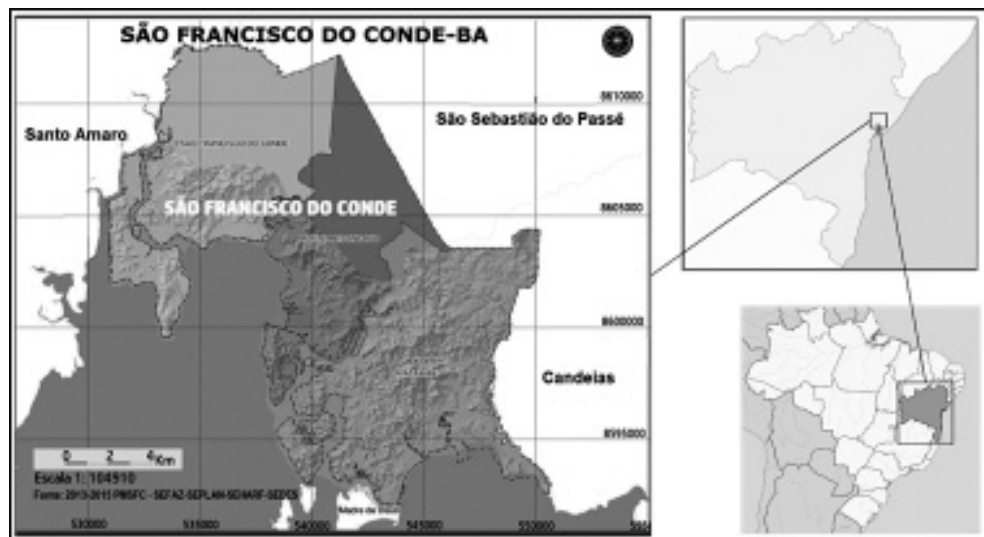
Figura 1: Localização do Município de São Francisco do Conde-BA-BR. Fonte: SEFAZ/SEPLAN/SEHARF/SEDES, 2013/2015. Adaptação: Edvaldo Santos, dez. 2016

Fontes são as únicas urbanizadas com ocupação populacional (mesmo sendo de baixa densidade demográfica). Paty possui por poucos moradores (cerca de 152 moradores, segundo dados da Secretaria Municipal de Planejamento. Abriga uma escola municipal de ensino fundamental,