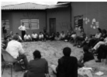
Fotos 1-4: Atividades formativas do COE-DUCA, 2007-2009.