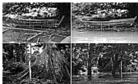
Figura 4: Variação do nível das águas (seca e cheia).

O Parque Nacional de Anavilhanas localiza-se no rio Negro, cerca de 40 km a acima da cidade de Manaus. Diz-se que o número de 400 ilhas existentes na área variam devido a sazonalidade do rio marcada pela pluviosidade e pela alteração do nível dos rios, que pode chegar a mais de 15 metros em algumas regiões (Figura 4), que por sua vez é consequência das variações climáticas anuais que ocorrem na região e na