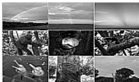
Figura 2: Habitantes da ilha.

Habitam na ilha de arco-íris (Figura 2) a fauna e a flora amazônica, com formações florestais diversas como floresta densa