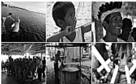
Figura 11: Moradores Tradicionais.

Sabe-se que a ocupação humana tem sido vista como um problema para a preservação ambiental, portanto, é fundamental realizar discussões e ações de desenvolvimento, articuladas à educação e conservação ambiental, com a população local, pois estes também devem propor soluções para produção ou programas de geração de renda.