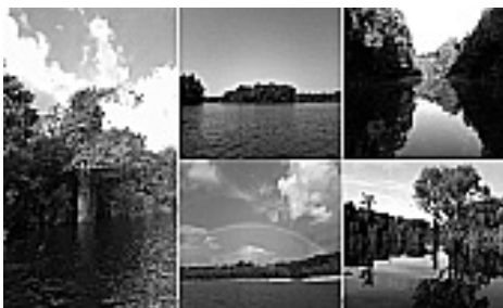
Figura 6: Igarapés.

A área do arquipélago de Anavilhanas encontra-se incluída no Programa de Proteção da Biodiversidade do Amazonas, criado através do Decreto nº 86.061 de 02.06.1981 na categoria de Estação Ecológica de Anavilhanas, localizada no Estado do Amazonas, Municípios de Manaus, Airão e Novo Airão, composta de 03 (três) áreas no total de 350.018 ha (trezentos e cinquenta mil e dezoito hectares). Através da Lei nº 11.799 de 29.10.2008 a Estação Ecológica de Anavilhanas foi recategorizada para Parque Nacional de Anavilhanas.