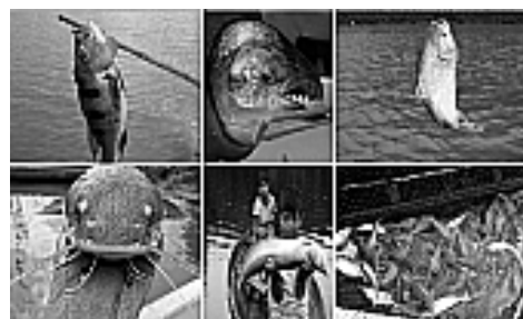
Figura 9: Variedades de peixes.

A metodologia adotada baseia-se na modalidade pesquisa-ação participante de cunho qualitativo, por meio de consultas bibliográficas e visita de campo in loco na área de entorno dos municípios limítrofes