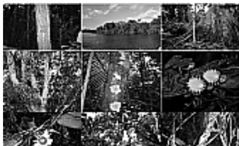
Figura 7: Espécies da flora.

As árvores chamadas de emergentes são aquelas que se destacam das outras por serem bem maiores que a maioria. Entre elas destacam-se a Samaúma, a Castanheira, o Mogno e o Angelim (CUNHA, 2013) e a fauna são bastante rica (Figura 8), além de uma variedade de insetos, aves garças, gaviões, araras, papagaios, tucanos e bacuraus. A maior parte da fauna é composta por animais que habitam as copas das árvores, entre 30 e 50 metros de altura.