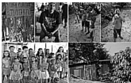
Figura 5: Comunidades de Anavilhanas.

Assim, as práticas de Educação Ambiental buscam esclarecer e conscientizar as comunidades sobre as necessidades de mudança de atitude frente à degradação dos ecossistemas e desvalorização das minorias.