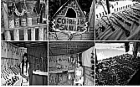
Figura 10: Artesanato tradicionais.

Desta feita conclui-se que se faz necessário uma reflexão sobre a relação, turismo, desenvolvimento econômico, sustentabilidade, educação e conservação ambiental, como solução para a ocupação humana dos moradores tradicionais (Figura 11) do Parque Nacional de Anavilhanas refletidas na inter-relação entre a sociedade e seu ambiente.