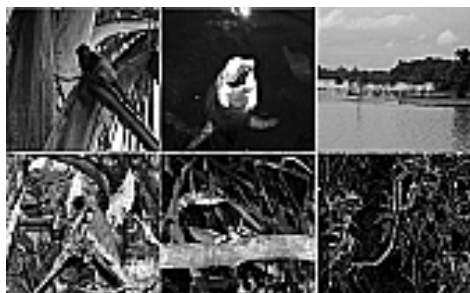
Figura 8: Espécies da fauna.

Cerca de 500 espécies de peixes (surubins, filhotes, pacus e pirarucus (Figura 9) dentre outros) comuns e diversas espécies de animais como botos, antas, jaguatiricas, jacarés, preguiças, morcegos, macacos e cobras completam o ecossistema lacustre e fluvial, que preserva, ainda, espécies ameaçadas de extinção, como o peixe-boi e a ariranha.