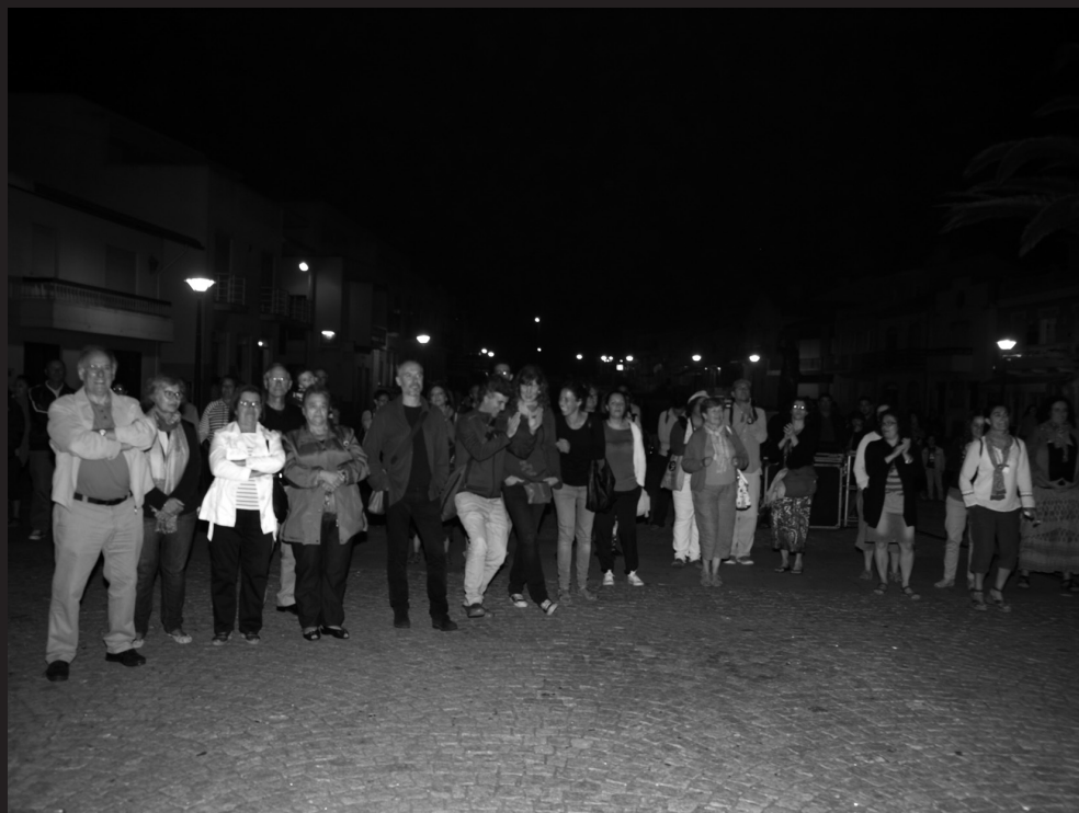
III Congresso Internacional de Educação Ambiental dos Países e Comunidades de Língua Portuguesa