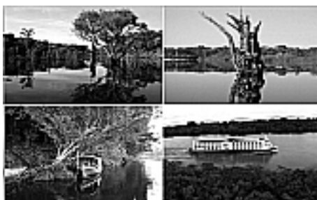
Figura 3: Inúmeros igarapés, paranás, canais.

Possui, além de inúmeros igarapés também área de terra firme, paranás e vários canais entre as ilhas (Figura 3), navegáveis por barcos de grande porte.